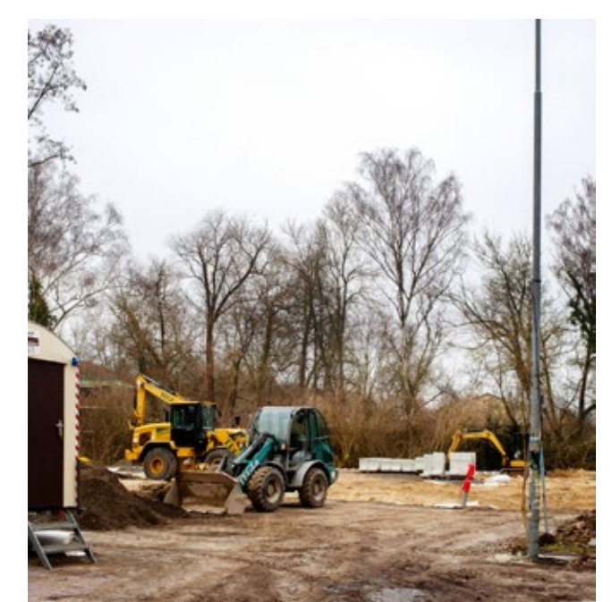
Baustelle für den neuen Spielplatz in der Götelstraße

Auf längere Sicht steht aber noch ein wichtiges Thema auf der Agenda: nämlich die geplante Durchwegung vom Metzger Platz zum Havelufer, eines der Schlüsselprojekte im »Lebendigen Zentrum Wilhelmstadt«. Ziel ist es, die Flächen im Bereich des Burgwalls besser an den Geschäftsbereich Pichelsdorfer Straße anzubinden und damit das Havelufer als wohnungsnaher Grünbereich für die Bewohner der Wilhelmstadt besser zu erschließen. Hierfür sind erste wichtige Schritte bereits erfolgt: So wurde im Jahr 2015 der Bauabschnitt Metzger Platz bis Krowelstraße realisiert. Der Abschnitt von der Straße Spandauer Burgwall bis zum Havelufer (Hermann-Oxford-Promenade) wurde im Zuge des Lückenschlusses des Havelradweges zwischen Ziegelhof und Burgwallgraben bereits im Jahr 2012 umgesetzt, ebenso der Teilabschnitt Bethanienweg (an der »Residenz Havelgarten«). Nun zeichnet sich auch eine technische Lösung für die Querung des Burgwallgrabens ab. Das ist ein weiterer wichtiger Schritt zur Realisierung des Gesamtprojekts.