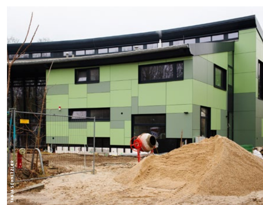
Wildwuchs-Neubau, fast fertiggestellt

In diesem Jahr wird natürlich die Umgestaltung der Pichelsdorfer Straße fortgesetzt (siehe auch S. 5). Auch weitere, bereits begonnene Vorhaben werden fortgeführt, so der Bau der Sporthalle an der Christoph-Förderich-Grundschule (mehr dazu auf S. 7) und der Bau eines neuen inklusiven, barrierefreien Spielplatzes für den Infrastrukturkomplex in der Götelstraße. Und in diesem Jahr wird endlich das neue Gebäude für den SJC Wildwuchs in der Götelstraße fertiggestellt. Es ist auch höchste Zeit: Immerhin haben die Kinder und Jugendlichen sowie die Sozialarbeiter der Jugendfreizeiteinrichtung nun schon den siebten Winter in Behelfscontainern zubringen müssen. Ein konkreter Termin der feierlichen Einweihung steht allerdings bislang noch nicht fest. Ebenfalls in diesem Jahr soll der Umbau des Metzger Platzes beginnen, so wurde es den Anwohnerinnen und Anwohnern bei der öffentlichen Informationsveranstaltung im Herbst letzten Jahres angekündigt. (Wir berichteten ausführlich in der Wilma Nr. 3/2023 über die Planungen.)