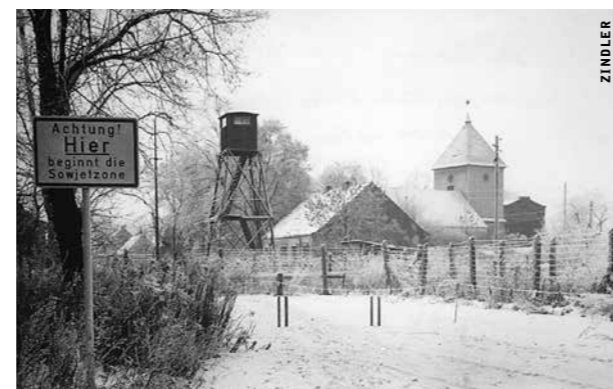
Staaken »west« – Bus mit Friedhofsbesuchern, 22.11.53 (oben) Mauer und Dorfkirche 1959 (unten)

Mit dem Verwaltungsregime begann auch die Zeit mit deutlichen Grenzen, mit Bretterzaun und Stacheldrahtspitzen, mit Schlagbäumen und Kontrollen an der Heer-