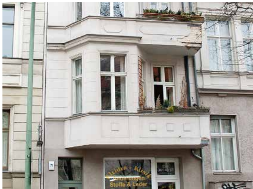
Mit Stuck verzierter Balkon als Merkmal der alten wilhelminischen Bürgerhäuser