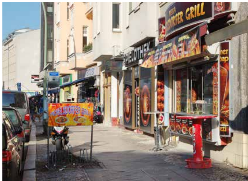
Erdgeschosszone und Gehweg in der Pichelsdorfer Straße