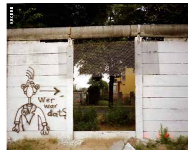
Mauer und Dorfkirche in den 80er Jahren (oben) Mauerdurchbruch in Staaken in den 90er Jahren (unten)